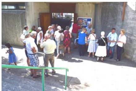
Entrée façade nord